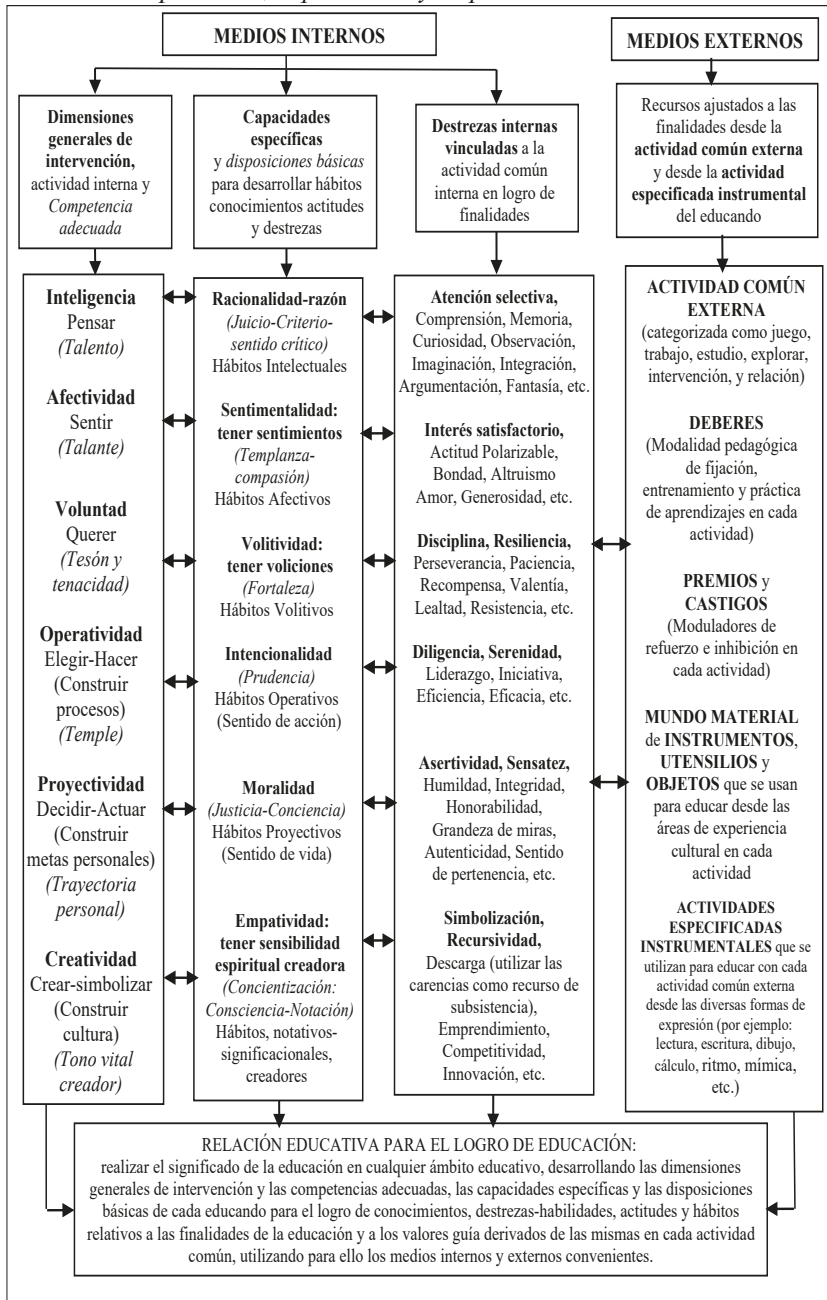
Cuadro 00: Medios internos y externos vinculados a dimensiones, actividades, competencias, capacidades y disposiciones del educando

Fuente: Touriñán, 2024, p. 454. Elaboración propia.